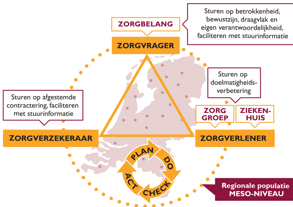
In de proeftuin Slimmer met Zorg gaat het om een andere manier van aansturing. Het figuur geeft weer hoe de partners in de "zorgdriehoek" in de proeftuin gezamenlijk verantwoordelijkheid nemen voor de resultaten op populatieniveau.

project en dat wij er als zorggroep aanspreekbaar op zijn. Sommige huisartsen waren al redelijk gevorderd met therapeutische substitutie en het formularium, en zagen vooral uitdagingen in de reviews die we zullen gaan doen: