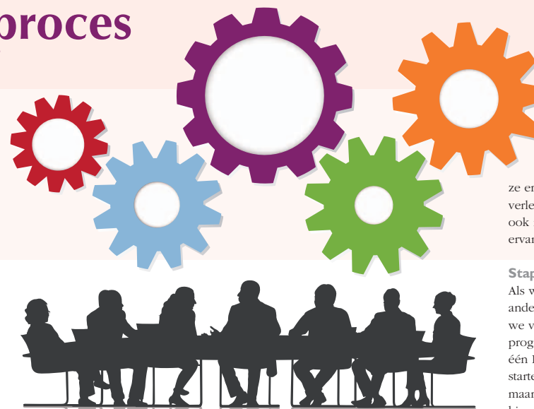
Vijf sleutelthema's zijn als zachte factoren aantoonbaar van invloed op de effectiviteit van een samenwerking, namelijk: gezamenlijke ambitie, belangen, relaties, organisatie en proces.

gemeenschappelijke ambitie weer af. Een belangrijk aspect bleek dat de wederzijdse afhankelijkheden tussen de verschillende organisaties niet toenamen gedurende deze periode. Zo constateerden we ook dat de procesorganisatie beter had gekund. Verantwoordelijkheden werden gaande de samenwerking helderder. De gedeelde ambitie om tot een gezamenlijk werkgeverschap te komen is deels gelukt. Vier van de zeven praktijken zijn hiermee doorggegaan. Drie praktijken participeren niet in het gezamenlijke werkgeverschap en hebben de POH-ggz elders ondergebracht.