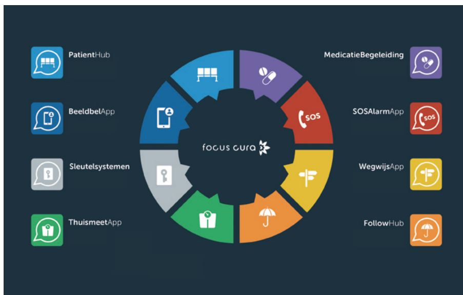
Diverse apps van Focus Cura ondersteunen zorgfunctionaliteiten voor ouderen

Een ander voorbeeld voor toepassing in de eerstelijnszorg is de ThuismeetApp. Chronisch zieken doen thuis metingen die voor de arts of voor het medisch servicecenter in een overzicht worden voorzien van een groen, oranje of rood