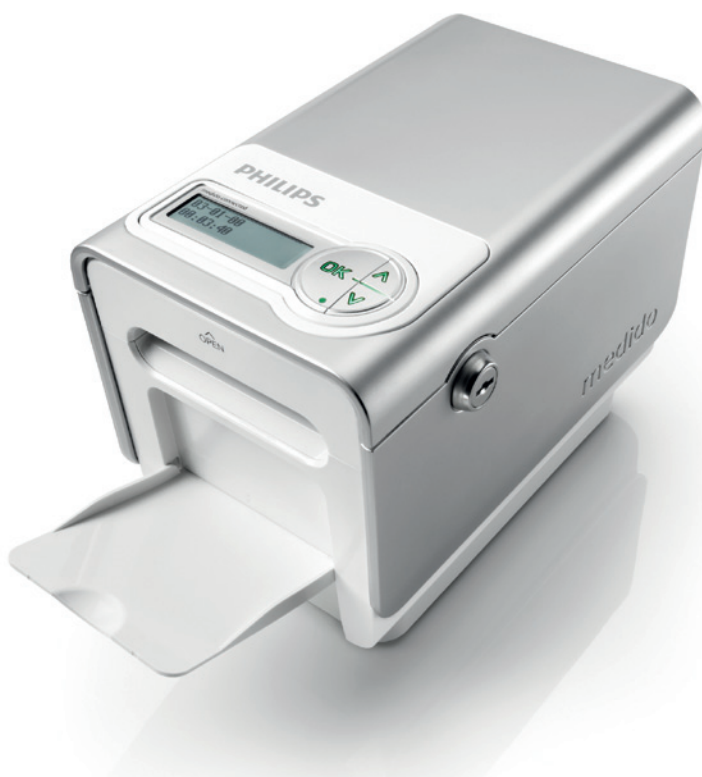
De Philips Medido houdt op afstand in de gaten of ouderen hun medicatie innemen

Met diverse apps ondersteunt het bedrijf van Dohmen het gehele spectrum van zorgfunctionaliteiten voor ouderen. De patiënten en sociale omgeving kunnen gebruikmaken van de eigen devices, krijgen in sommige gevallen een iPad in bruikleen of huren deze. Om het gebruik te vereenvoudigen is een schil over verschillende functies heen gebouwd, waardoor videocontact een fluitje van een cent wordt en adressen van profes-