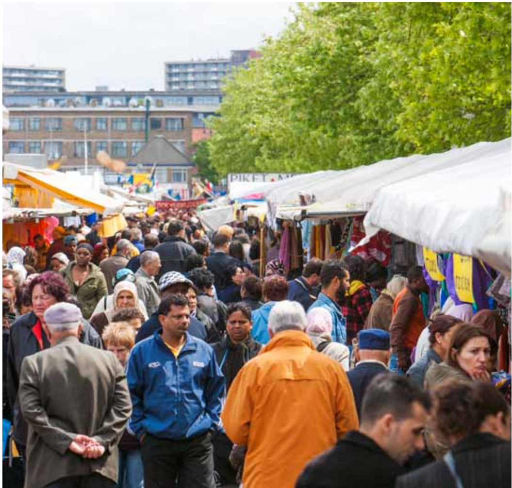
De Mededingingswet regelt de marktwerking maar staat samenwerking en doelmatige zorg in de weg.